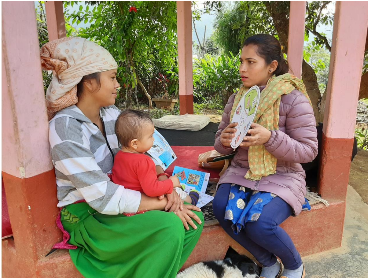
Home visit counseling before lock down period