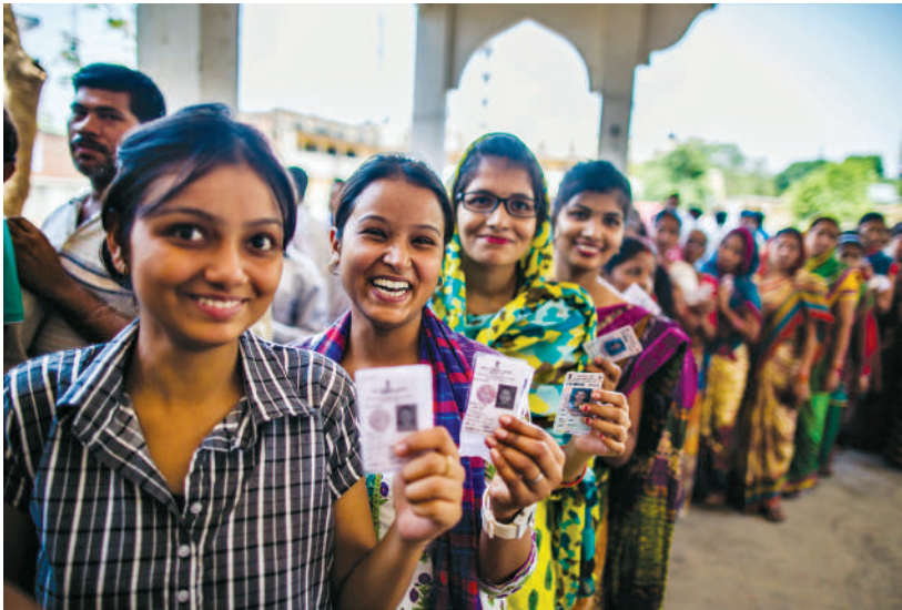
यूएनडीपी इन्डिया भारतीय निर्वाचन २०१४ । फोटो : प्रशान्त विश्वनाथन

अधिकांश संसद्हरूमा रहेको सबैभन्दा बलियो शक्ति भनेको सार्वजनिक चासोको कुनै पनि विषयमा जाँचबुझ गर्न सक्ने क्षमता हो । संसद् कार्यसञ्चालन नियमावलीले त्यस्तो जाँचबुझका लागि विभिन्न प्रक्रियाहरू अवलम्बन गर्नुपर्ने व्यवस्था गरेको हुनसक्ने भए तापनि त्यस्तो छानवीन गर्न पाउने शक्ति ज्यादै बलियो माध्यम हो, जसलाई सांसदहरूले एसडीजी मुद्दाहरूको महत्वप्रति ध्यान आकर्षित गर्न प्रयोग गर्नसक्छन् । जाँचबुझ विद्यमान समितिमार्फत हुनसक्छ ।