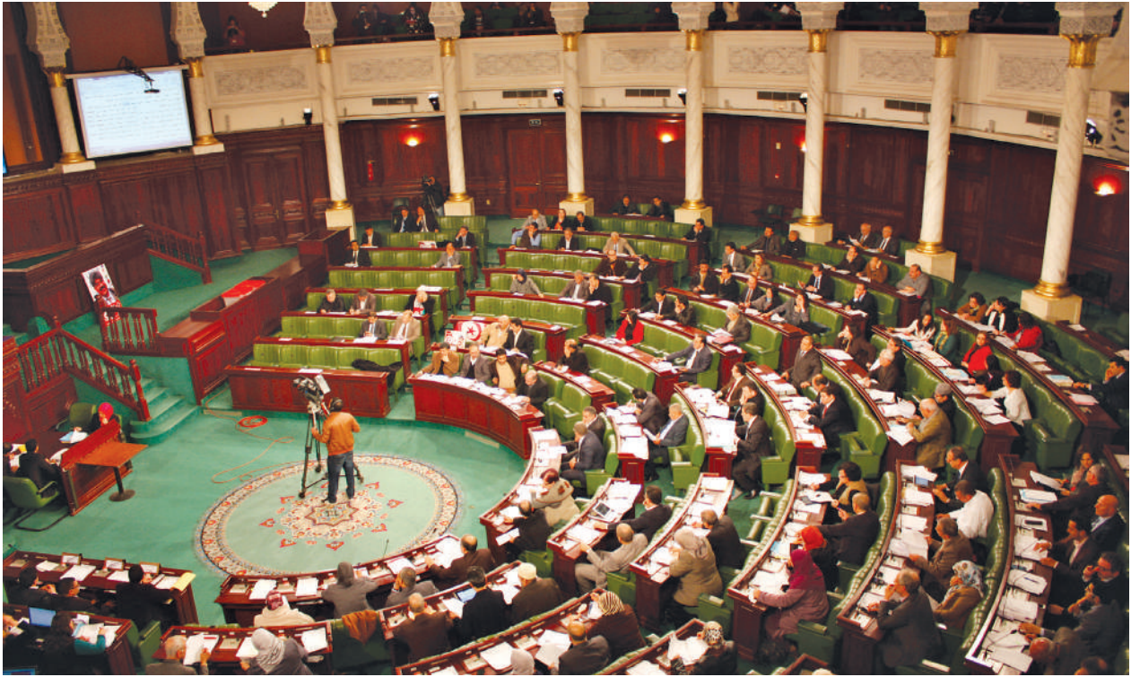
यूएनडीपी द्युनिसिया द्युनिसियाको संविधानमाथि भइरहेको बहस, २० जनवरी २०१४ ।

आदर्शतः प्रस्तावित मसौदा कानुनले स्पष्ट रूपमा त्यसले २०३० एजेन्डा र/वा खास एसडीजी र तिनका लक्ष्यहरूलाई सहयोग गर्छ वा गर्दैन र कसरी गर्छ भन्ने कुरा पहिचान गरेको हुन्छ । यो मसौदा कानुनको व्याख्यात्मक नोट र मसौदा कानुनको परिचयात्मक भनाईमा समावेश हुनसक्छ । तथापि, हाल यो प्रचलित अभ्यास होइन । यसलाई सम्बोधन गर्न, संसद्हरूले प्रस्तावित मसौदा कानुनले एसडीजीहरूको उपलब्धिमा कसरी प्रभावित गर्छ भन्ने कुराको पहिचान गर्न आफ्नो संसदीय सचिवालयबाट "एसडीजी प्रभाव विश्लेषण" गराउन सक्छन् । विकल्पको रूपमा नियमावली संशोधन गरेर कानुनका प्रस्तावकले मसौदा कानुन प्रस्तुत हुँदा त्यस्तो विश्लेषण विकसित गर्नुपर्ने प्रावधान राख्न सकिन्छ । केही देशले मसौदा कानुनको सामाजिक तथा आर्थिक वा लैङ्गिक प्रभाव मूल्याङ्कन गर्न सुरु गरिसकेका छन् । विगतको पाठले त्यस्तो प्रक्रियालाई एउटा साधारण रुजूसूचीको विकास गरेर व्यवस्थित गर्न सकिने बताउँछ, जसलाई विचारका लागि प्रस्तुत हरेक मसौदा कानुनका लागि संसदीय सचिवालयले लागु गराउन सक्छ । सांसद्हरूले त्यसपछि यो सूचना संशोधनका क्षेत्रहरूको पहिचान गर्न सक्छन् ।