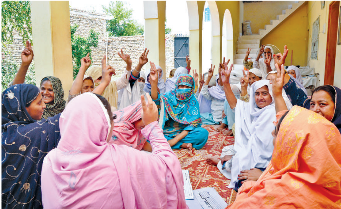
यूपएनडीपी पाकिस्तान महिला सामुदायिक संस्था “समातनजीम” गाउँ “पाघना” र हरिपुर जिल्लाको केन्द्रीय परिषद् “धिन्डा” । सामान्य मुद्दाहरूमा छलफल ।

एसडीजी कार्यान्वयन उपराष्ट्रिय र स्थानीय सरकारसँगको समन्वयमा र देशभरीका जनताको योगदानसाथ भएको सुनिश्चित गर्न संसदले लिन सक्ने निर्दिष्ट कदमका केही माध्यमहरू देहाय अनुसार रहेका छन् ।