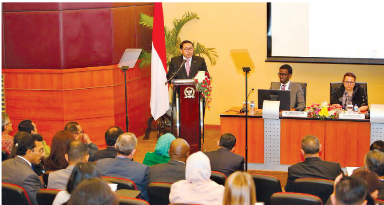
संसद् र एसडीजीहरूसँगबन्धी क्षेत्रीय कार्यशाला, ३०-३१ अगस्त २०१६, जकार्ता, इन्डोनेसिया

एसडीजीहरूको कार्यान्वयनको अनुगमन गर्ने र मुख्य विकास उद्देश्यहरू पूरा गर्ने प्रयासमा संसद् र सांसदहरू एकलै छैनन् भन्ने कुरा जान्नु महत्वपूर्ण हुन्छ । क्षेत्रीय र अन्तर्राष्ट्रिय रूपमा सक्रिय संस्थाहरू छन्, जसले एक वा एकभन्दा बढी एसडीजीहरूका उपलब्धिहरूलाई प्रवर्द्धन गर्ने काम गरिरहेका छन् । यीमध्ये केही समूहहरू तपाईंको संसद्मा संलग्न भइसकेका हुनसक्छन्; यदि छैन भने सांसद् र संसद्को काममा उनीहरूको क्षमता अभिवृद्धि गर्न र आफ्नो देशमा एसडीजीहरूको कार्यान्वयनमा पूर्ण र सक्रिय साभेदार बन्ने प्रयासमा मद्दत पुऱ्याउन सक्छन् ।